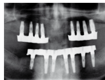
RX panoramica con impianti osteointegrati

Per l'intervento il paziente viene preparato con sedativi per vincere l'ansia e con un adeguato dosaggio di anestetico che permette di controllare il dolore intraoperatorio, mentre gli antidolorifici comuni lo aiutano a sopportare il dolore postchirurgico. Dopo qualche mese, quando il processo di osteointegrazione e di guarigione si è realizzato, si procede alla finalizzazione con protesi definitiva, che è in ceramica, con forma, volume e colore dei denti esteticamente eccellenti. Tutti i denti sono av-