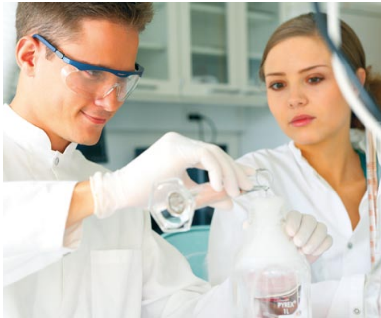
Un team impegnato nell'analisi e il controllo del prodotto finale.

Ricerca scientifica condotta in collaborazione con Università e aziende per risultati d'eccellenza